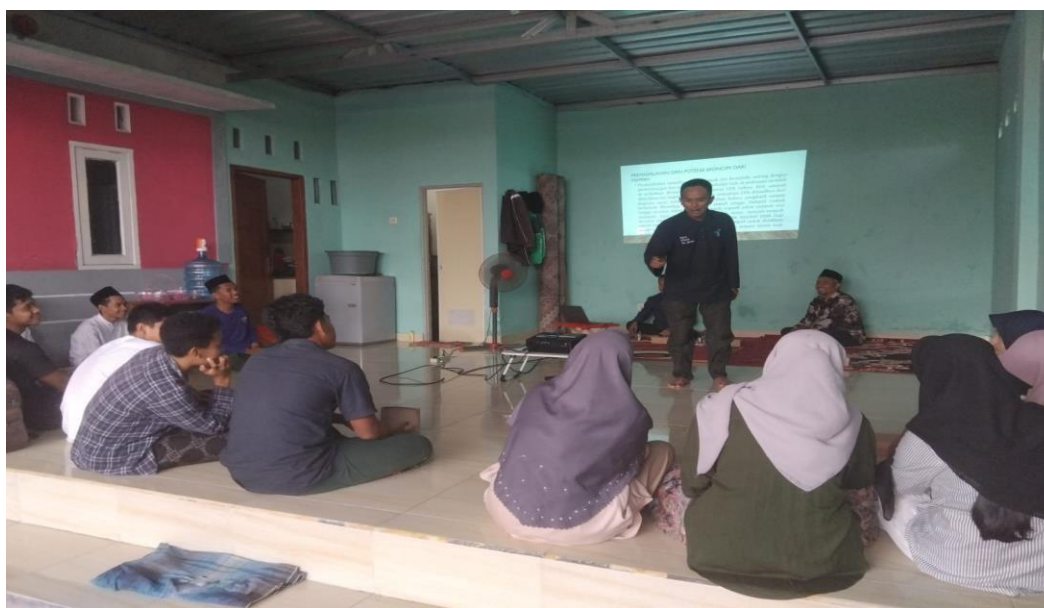
Gambar 1. Pelatihan Konten kreatif.

Pelaksanaan pelatihan konten kreatif dan editing video bagi pemuda di pedesaan menunjukkan antusiasme yang tinggi sejak tahap awal kegiatan. Sebanyak 32 peserta yang berusia 16–25 tahun mengikuti sesi pembelajaran secara penuh mulai dari pengenalan produksi konten hingga praktik editing video menggunakan perangkat mobile dan laptop. Observasi awal menunjukkan bahwa 87% peserta belum memiliki pengalaman sebelumnya dalam proses produksi video, namun memiliki ketertarikan besar untuk memanfaatkan media digital sebagai peluang ekonomi kreatif. Hal ini mengindikasikan bahwa pelatihan tepat sasaran dan mampu menjawab kebutuhan pemuda desa terhadap literasi digital kreatif.