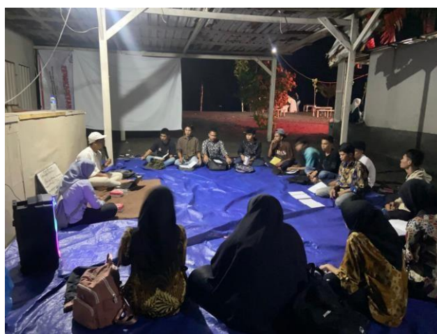
Gambar 2 Penyampaian Materi Edukasi