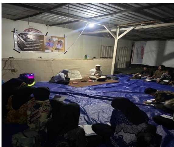
Gambar 1 Penguatan Literasi Sosial

Secara umum, hasil kegiatan menunjukkan bahwa kegiatan ini telah berhasil mencapai tujuan utama, yaitu memperkuat literasi sosial, memperkokoh nilai-nilai peradaban, serta meningkatkan solidaritas sosial di kalangan mahasiswa rantau. Melalui kegiatan ini, mahasiswa tidak hanya memperoleh pengetahuan konseptual, tetapi juga mengalami proses pembelajaran sosial yang membentuk karakter dan sikap positif terhadap lingkungan sosial mereka.