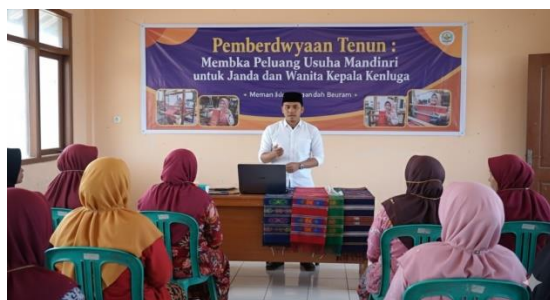
Gambar 1. Sosialisasi dan Pembentukan Kelompok

Pada tahap awal, tim pengabdian melakukan sosialisasi program kepada pemerintah desa, tokoh masyarakat, dan calon peserta. Sebanyak 15 orang perempuan janda dan kepala keluarga resmi bergabung dalam kelompok “Tenun Mandiri Sangiang”. Tahap ini juga mencakup diskusi awal mengenai tantangan ekonomi perempuan pasca pandemi dan potensi tenun sebagai sumber penghasilan alternatif.