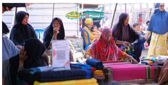
Gambar 2. Kegiatan Pelatihan Tehnis Menenun Tembe nggoli

Kegiatan pelatihan dilaksanakan di Balai Desa Sangiang dengan menghadirkan instruktur lokal berpengalaman. Peserta mendapatkan pelatihan langsung mengenai: